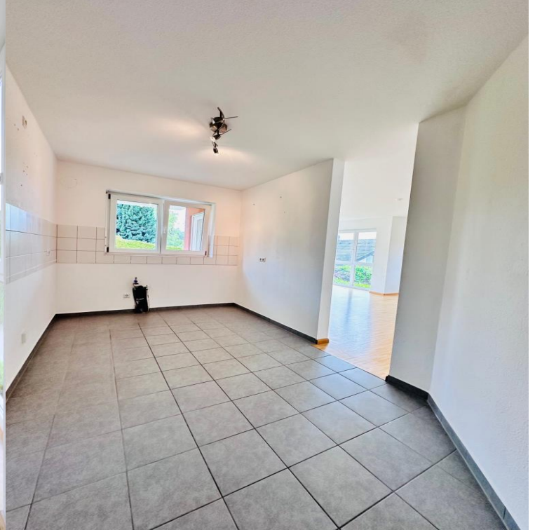
1.Obergeschoss, Wohnung Nr. 2B